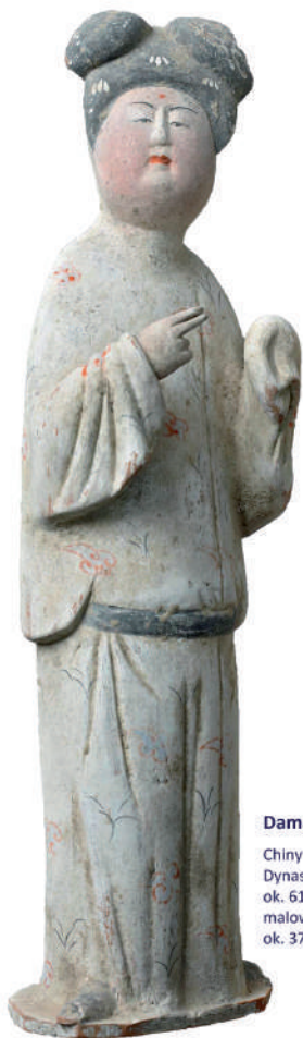
Dama dworu i szlachcic

Chiny Dynastia Tang ok. 618–907 r. n.e. malowana terakota ok. 37 cm